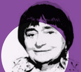
בתמיכת: פסטיבל חיפה