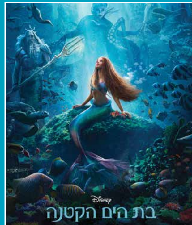
25.5- < בת הים הקטנה (דיבוב עברי/אנגלית)

מומלץ להצטייד בלבוש חם בבואכם לקולנוע במהלך כל השנה - הקופות תפתחנה שעה לפני תחילת הקרנת הסרט הראשון, ימי הפעילות מפורטים באמצעי הפרסום - לפרטים ורכישת כרטיסים מראש באמצעות אתר האינטרנט או ליי: www.hcinema.org.il - לבחורים בנושאי סרטים, מנויים ולהזמנות בקופה: 09-9565008 - ניתן ורצוי להשאיר הודעה ברורה הכוללת שם מלא ומספר טלפון, החזרה אל הפונה תעשה בשעות פעילות הקופות - להבטחת הזמנתכם מומלץ להתקשר לפחות 72 שעות לפני ההקרנה - על ביטולים יש להודיע עד שעתיים לפני תחילת הסרט בטלפון או במייל - יתכנו שינויים בתוכנית החודשית ובמועדי ההקרנה בשל סיבות שאינן קשורות בסינמטק, נא להתעדכן תמיד בסמך למועד ההקרנה - מקומות מסומנים ישמרו למטיים עד 5 דקות לפני תחילת ההקרנה, המאחרים יודרכו למקומות פנייים על פי המצאי - לשם הפיכת תהליך הזמנת הכרטיסים לקל וידידותי, המנויים מתבקשים להשתמש במערכת הכרטיס המתקדמת באינטרנט, ולקבלם במכשיר הסינמט בקומת האולמות - בהרצאה וסרט לא תינתן אפשרות כניסה ברגע שההרצאה התחילה. כניסת המאחרים תאפשר להקרנה בלבד, מקומותיהם ישמרו - אין הסינמטק אחראי למצב הטכני של הסרטים - לסינמטק תקן נגישות הכולל מערכת עזר לכבדי שמיעה.