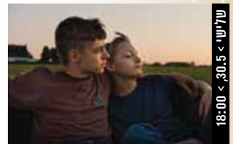
שלישי > 30.5 < 18:00

שחקנים: וורן ביטי, דיאן קיטון, ג'ק ניקולסון (194 דק', אנגלית, תרגום לעברית ולצרפתית) פרס הבמאי הטוב ביותר, פרס הצלם הטוב ביותר ופרס שחקנית המשנה הטובה ביותר, אוסקר 1982