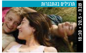
תרגילים בהתבררות שבן > 20.5 < 18:30