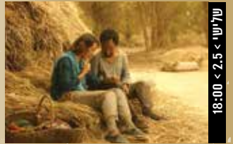
שלישי > 2.5 < 18:00