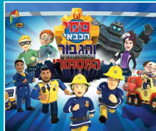
6.5 < סמי הכבאי והגיבור המסתורי (דיבוב עברי)

10.5 תערוכות על המסך: חמניות 16.5 קולנוע זמיר: הכי מתוק שיש 17.5 תור הזהב של המיזיקלס: תור האביב הגיע 31.5 קרלוס סאורה: חונת הדמים