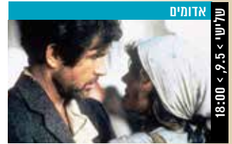
אדומים שלישי > 9.5 < 18:00

שחקנים: וו רָנְלִין, האי צ'ינג, גואנגרזי יאנג (133 דק', מנדרינית; תרגום לעברית ולאנגלית)