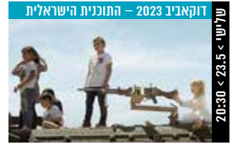
דוקאבי 2023 – התוכנית הישראלית שבן > 23.5 < 20:30