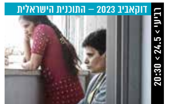
דוקאבי 2023 – התוכנית הישראלית שבן > 24.5 < 20:30

הפקה: הילה מדליה, סיגריד דייקיר (101 דק', עברית; כתוביות בעברית) בתום ההקרנה תתקיים שיחה עם גיא דודי, יוצר הסרט.