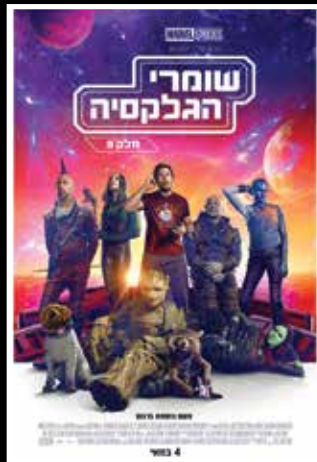
החל מ-4.5 < שומרי הגלקסיה 3