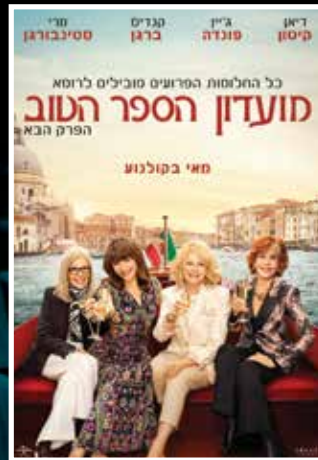
החל מ-25.5 < מועדון הספר הטוב – הפרק הבא