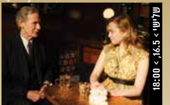
שלישי > 16.5 < 18:00

שחקנים: אָדן דִמְבְּרִין, גוסטב דה-אָלה, אָמילי דוקו (104 דק', צרפתית, פלמית, הולנדית, אנגלית; תרגום לעברית ולאנגלית)