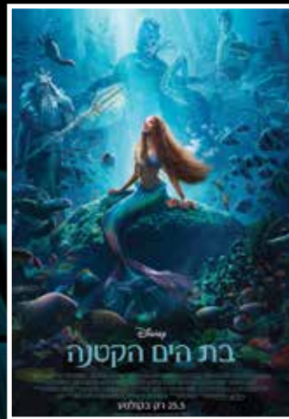
החל מ-25.5 < בת הים הקטנה