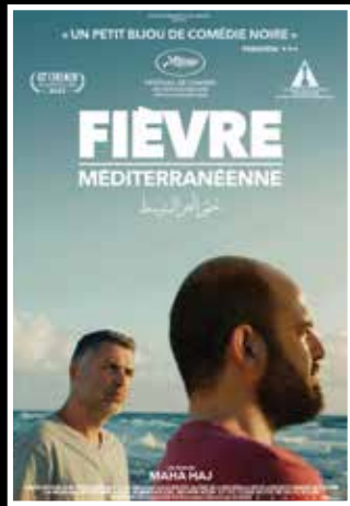
החל מ-13.5 < קדחת ים תיכונית