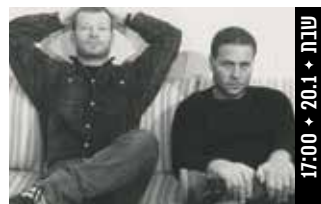
בגלל המלחמה ההיא Because of That War (ישראל, 1988) תיעודי

תיעוד תהליך היצירה של "אפר ואבק", אלבוםם של יהודה פוליקר ויעקב גלעד ("בניזין") שזור בשיתוף עם היוצרים והוריהם על הקשר הבין-דורי הטעון והמציאות של בני הדור השני לשואה, שגדלו ועודם חיים בצל הטראומה של הוריהם.