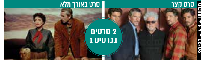
סרט באורך מלא

מיוזיקל מקורי. בישראל של 1967, על רקע ימי האופוריה התוססים שלאחר הניצחון במלחמת ששת הימים, מביא הסרט את סיפורם של שני זוגות חברים מקיבוץ נצר סירני, שהמלחמה והניצחון בה ישנו את חייהם ללא היכר. זהו סיפורם של אלו שהפסידו בניצחון. בסרט משולבים 14 שירים