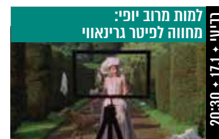
חוזתה השרטט The Draughtsman's Contract (בריטניה, 1982) דרמה קומית