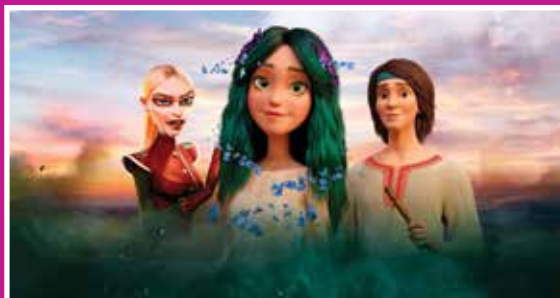
מאווקה נסיכת היער החל מ-25.1 בכל יום (דיבוב עברי)