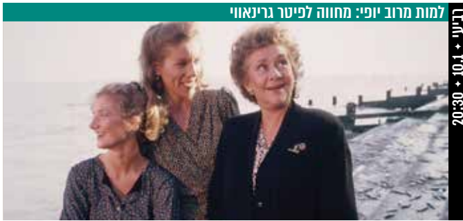
למות מרוב יופי: מחווה לפיטר גרינאווי