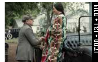
רוצחי פרח הירח Killers of the Flower Moon (ארה"ב, 2023) דרמה תקופתית

במאית: שי-לי עטרי שחקנים: יעל אלקנה, בן זאב רביאן, יואב בירן (29 דק', עברית; כתוביות בעברית) בתום ההקרנה התקיים שיחה בין שי-לי עטרי, יוצרת הסרט לאנה בורד.