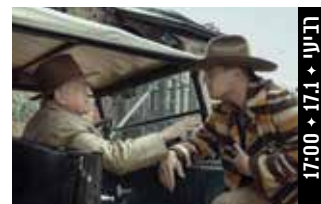
רוצחי פרח הירח Killers of the Flower Moon (ארה"ב, 2023) דרמה תקופתית

במאית: אורנה בן-דור הפקה: שירות הסרטים הישראלי. (95 דק', עברית; כתוביות בעברית)