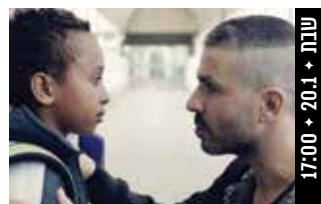
ילדים של אף אחד Children of Nobody (ישראל, 2023) דרמה

בתום ההקרנה התקיים שיחה עם אבנר ברנהיימר, תסריטאי הסרט.