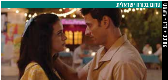
טרומ בכורה ישראלית

שחקנים: ג'וליאן מור, נטלי פורטמן, צ'רלס מלטון (117 דק', אנגלית; תרגום לעברית)