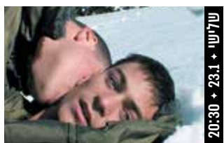
יוסי וג'אגר Yossi & Jagger (ישראל, 2002) דרמה

במאים: יוסי בלוק, דוקי דורר (52 דק', עברית; כתוביות בעברית) בתום ההקרנה התקיים שיחה עם יוצרי הסרט.