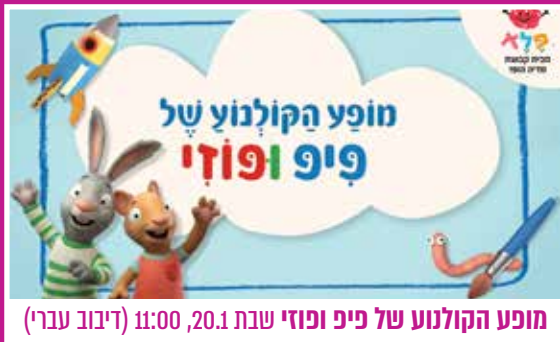
מופע הקולנוע של פיפ ופוזי (דיבוב עברי) 11:00 שבת 20.1, 11:00 (דיבוב עברי)