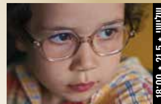
אמא גלוריה Ama Gloria (צרפת, 2024) דרמה 18:00 + 21.5 + טליווי

במאי: פדריקו פליני שחקנים: מרצ'לו מסטרויאני, אנוק איימה, קלאודיה קרדינלה (138 דק', איטלקית; תרגום לעברית)