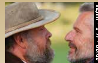
סוד החיים הפשוטים A Great Friend (צרפת, 2023) קומדיה 20:00 + 14.5 + טליווי

*** בני הגיל השלישי נהנים מקולנוע איכותי ב-10 ש' בלבד!