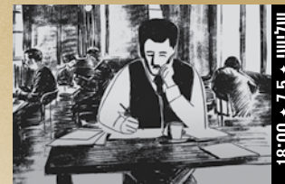
עסקה עם השטן A Deal With The Devil (ישראל, 2024) תיעודי 18:00 + 7.5 + טליווי

במאית: מרים טוזאני שחקנים: לובנה אזאבל, סאלח בכרי (118 דק', ערבית; תרגום לעברית)