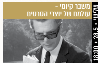
פליני: 8 1/2 Fellini: 8 1/2 (איטליה, 1960) דרמה 18:00 + 28.5 + טליווי

במאי: אבידע לבני קריינות: נעמי לבוב, שרון אלכסנדר (עברית; כתוביות בעברית) בתום ההקרנה תתקיים שיחה עם אבידע לבני, במאי הסרט.